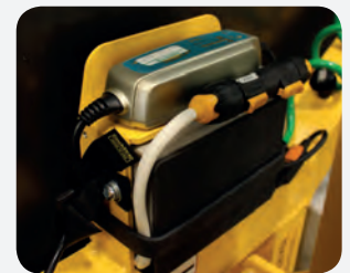
Nové a vylepšené nabíjení znamená, že zvedák MRT4 Intelli-Grip je efektivnější.