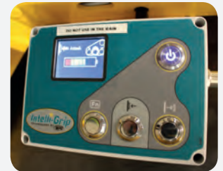
Technologie Intelli-Grip monitoruje vakuové zvedací zařízení v reálném čase.