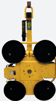
MRT4 - Compact Přísavné talíře