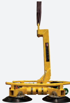
MRT4 - Compact Náklon