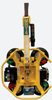
MRT4 - Compact