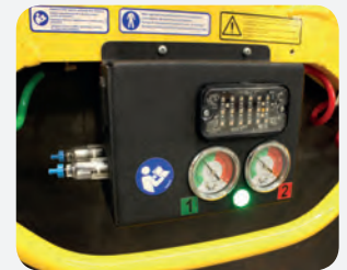
Představujeme nový dvouokruhový vakuový systém.